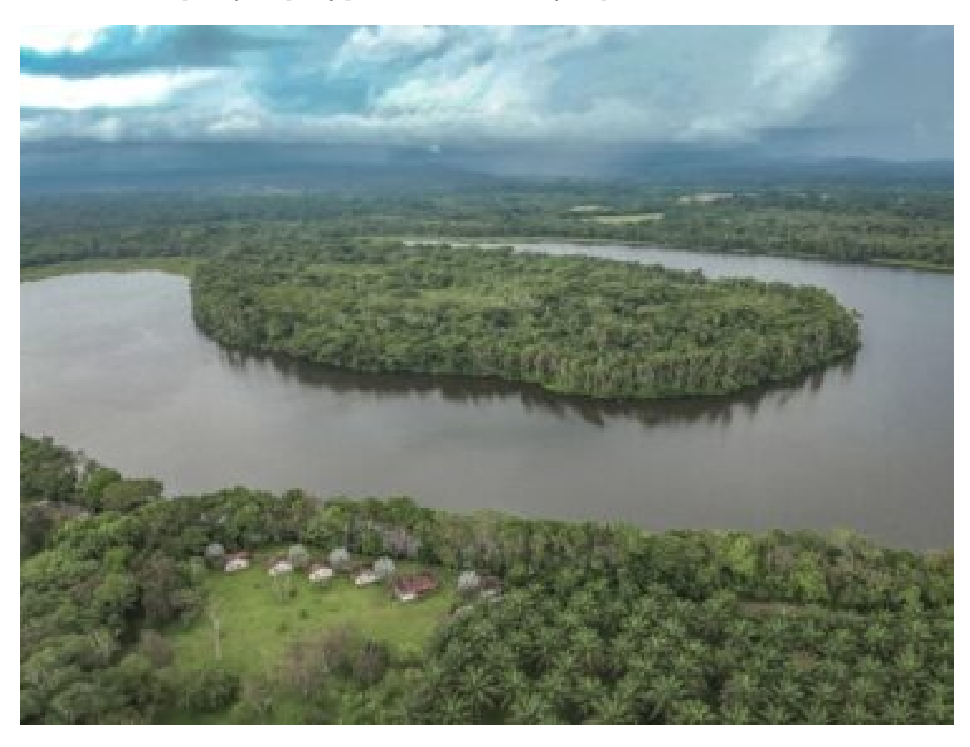
Visitar la Serranía de la Lindosa en San José del Guaviare es ideal, si te gusta: